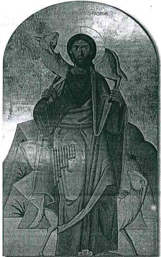
Nella foto: Icona del maestro Paolo Orlandi, Chiesa di San Valeriano, Codroipo.

La «carità pastorale», come dinamica interiore di un Amore grande ricevuto, ci aiuta quindi a convertire il nostro «fare il prete» nella più costruttiva consapevolezza dell'«essere prete»; questo, a beneficio delle tante persone che incontriamo e l'edificazione della nostra amata Chiesa friulana. Questo anno diocesano dedicato alla carità, sia dunque l'occasione per rinnovare e rafforzare interiormente quei sentimenti positivi e grandi che vengono dalla nostra ordinazione presbiterale: «Grazie a questa consacrazione operata dallo Spirito nell'effusione sacramentale dell'Ordine, la vita spirituale (del sacerdote) viene improntata, plasmata, connotata da quegli atteggiamenti e comportamenti che sono propri di Gesù Cristo Capo e Pastore