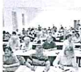
Il nuovo ISSR avrà sede in seminario

L'annuncio è ufficiale: in settembre comincerà l'attività il nuovo Istituto Superiore di Scienze Religiose della Diocesi di Trento "Romano Guardini". Approvato nello scorso aprile dalla Congregazione per l'Educazione Cattolica e collegato con la Facoltà Teologica del Triveneto, formerà gli insegnanti di Religione Cattolica per le scuole di ogni ordine e grado. "Vorrei che fosse un fiore all'occhiello della cultura locale, in dialogo col territorio", auspica l'Arcivescovo Tisi a Vita Trentina. All'interno interventi e testimonianze.