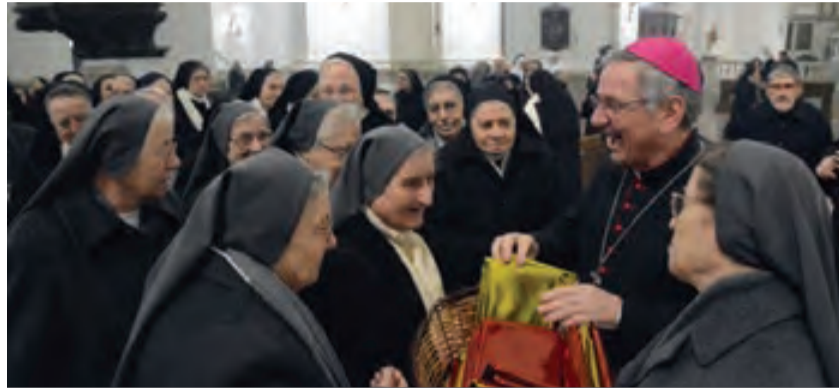
Il vescovo con alcune religiose alla Giornata per la vita consacrata (pre Covid).