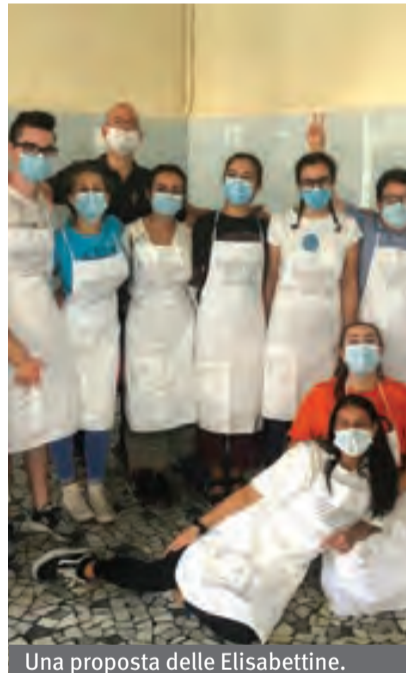
Una proposta delle Elisabettine.

L'esperienza sarà guidata da una équipe di quattro suore elisabettine