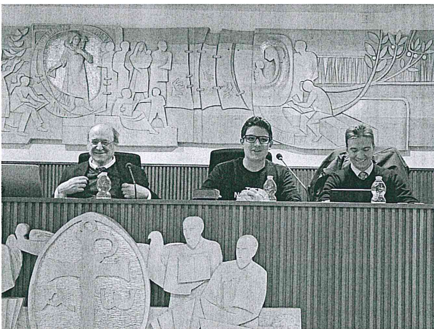
(Facoltà Teologica del Triveneto)