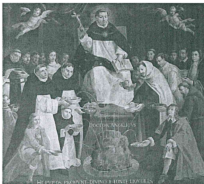
San Tommaso d'Aquino